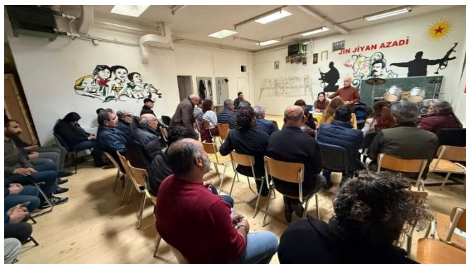
Kurdisches Treffen in Wien.

Organisator:innen stieß dieser Ansatz auf großes Interesse und breite Zustimmung. Besonderes Gewicht wurde auf die Rolle von lokalen Strukturen gelegt. Diese gelten als grundlegender Baustein einer demokratischen Organisation und sollen künftig stärker ausgebaut werden. Dabei ging es auch um die Frage, wie solche Strukturen konkret in der Praxis umgesetzt werden können. Ein weiterer Schwerpunkt lag auf der organisatorischen Ausrichtung innerhalb des österreichischen Systems. Die Teilnehmenden verständigten sich darauf, die künftigen Strukturen an die föderalen Gegebenheiten und rechtlichen Rahmenbedingungen in Österreich anzupassen.