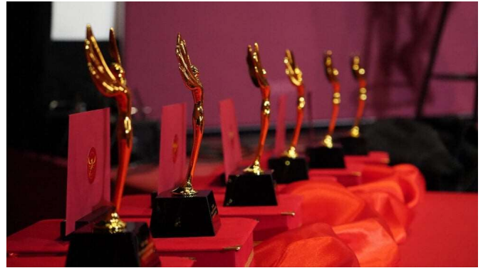
Preise Filmfestival Düsseldorf.