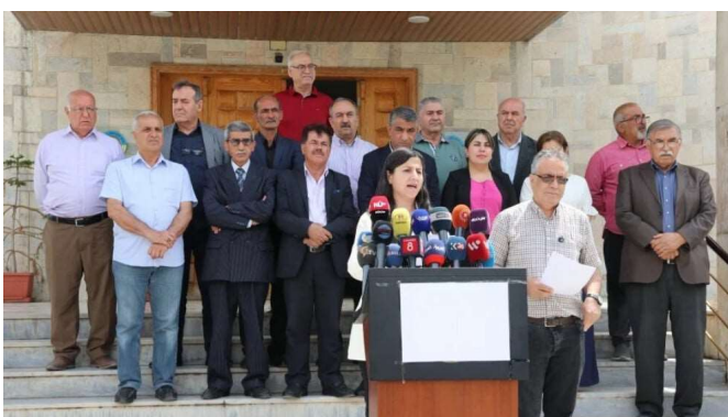
Kritik an Sitzverteilung im Parlament.

Zwei Dutzend kurdische Parteien und Organisationen aus Nordostsyrien haben die geplante Vergabe von lediglich vier Sitzen an Kurd:innen im syrischen Parlament zurückgewiesen. In einer gemeinsamen Erklärung forderten sie eine politische Repräsentation entsprechend des kurdischen Bevölkerungsanteils und warfen der Regierung in Damaskus vor, an ausgrenzenden und zentralistischen Strukturen festzuhalten. Eine entsprechende Erklärung wurde am 19. Mai vor dem Sitz des Ressorts für Außenbeziehungen der Demokratischen Selbstverwaltung abgegeben, nachdem die Parteien bereits am tags zuvor über die politische Entwicklung in Syrien beraten hatten.