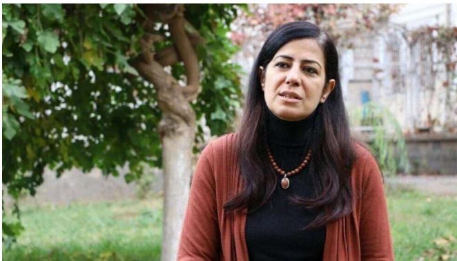
Ayla Akat Ata.

Der Europäische Gerichtshof für Menschenrechte (EGMR) hat die Türkei wegen der Inhaftierung der kurdischen Politikerin und Aktivistin Ayla Akat Ata verurteilt. Das Straßburger Gericht entschied, dass weder ausreichende Beweise für ihre Festnahme noch eine rechtmäßige Grundlage für ihre monatelange Untersuchungshaft vorlagen. Ayla Akat Ata war am 26. Oktober 2016 während einer Presseerklärung vor dem Rathaus in Amed (tr. Diyarbakır) festgenommen worden. Die frühere HDP-Abgeordnete wurde anschließend rund sechs Monate lang inhaftiert. Die Staatsanwaltschaft warf ihr unter anderem „Gründung und Leitung einer Terrororganisation“ vor. Als Belege dienten politische Aktivitäten im Umfeld der Graswurzelbewegung Demokratischer Gesellschaftskongresses (KCD), öffentliche Reden, Veranstaltungsteilnahmen sowie Beiträge in sozialen Medien.