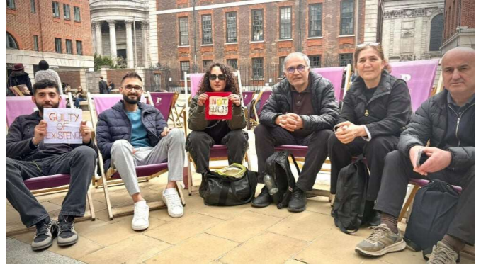
Proteste gegen die Justiz in London.

britische Staatsanwaltschaft CPS zurückgegeben, die nun bis zum 5. Juni entscheiden muss, ob es zu einer Neuauflage des Prozesses kommt.