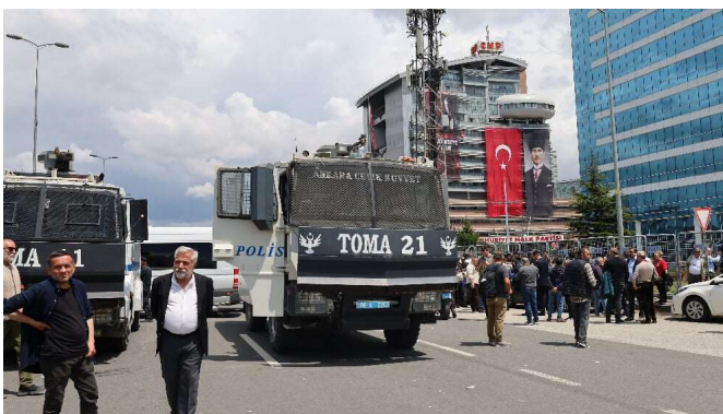
Sturm auf das CHP-Gebäude.

Die Auseinandersetzung um die gerichtliche Annullierung des Parteitags der CHP ist in Ankara eskaliert. Die türkische Polizei ging am 24. Mai gegen Menschen vor, die sich vor der Parteizentrale versammelt hatten, und drang später in das Gebäude ein. Bereits vor dem Hauptquartier setzten Einsatztrupps Tränengas, Wasserwerfer und Gummigeschosse ein. Im weiteren Verlauf des Überfalls verschafften sich die Polizeieinheiten dann Zugang zum Gelände und drangen anschließend auch in das Innere der Parteizentrale vor. Dort wurde ebenfalls Tränengas eingesetzt.