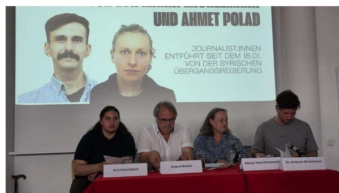
Pressekonferenz in Berlin.