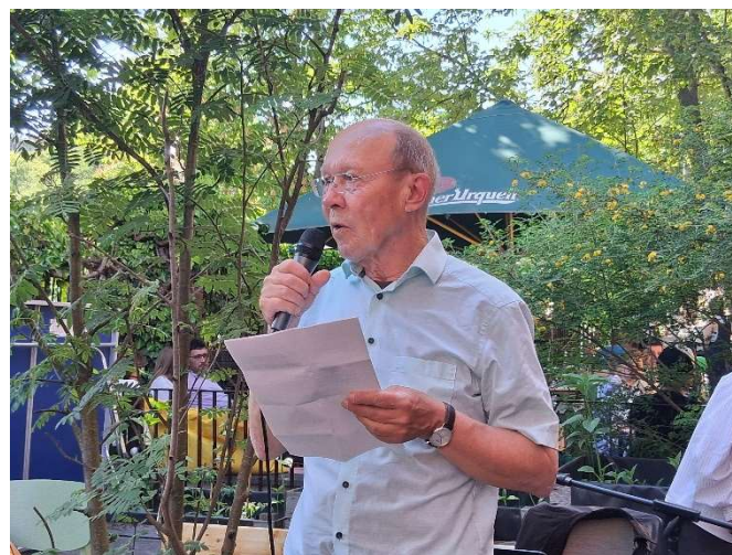
Rückblick auf Azadî von Elmar Millich.

Dem Vortrag über Geschichte und Wirkung des Vereins folgten mehrere Grußworte befreundeter Verbände. Für den Verein Republikanischer Anwältinnen und Anwälte (RAV) betonte Rechtsanwalt Dr. Lukas Theune die langjährige positive und intensive Zusammenarbeit seiner Kolleg:innen mit Azadî. Auch 30 Jahre nach der Gründung sei Azadî wichtiger denn je, um politisch aktive Kurd:innen in Deutschland vor straf- und ausländerrechtlichen Verfolgungsmaßnahmen zu schützen. Nach einer Einlage des kurdischen Musikers Cengiz Yazgi mit musikalischer Begleitung wurde ein Grußwort des Nationalkongress Kurdistans (KNK) verlesen, da die dazu eingeladene Freundin vom KNK durch Flugausfälle an der Veranstaltung kurzfristig nicht teilnehmen konnte. Der KNK-Beitrag betonte, dass Azadî seit seiner Gründung entschlossen auf der Seite von Gerechtigkeit, Würde und Freiheit stehe. Azadî habe Räume des Widerstands, der Kultur, der politischen Organisation und der internationalen Solidarität geschaffen. Dafür gebühre dem Verein großer Dank und tiefe Anerkennung.